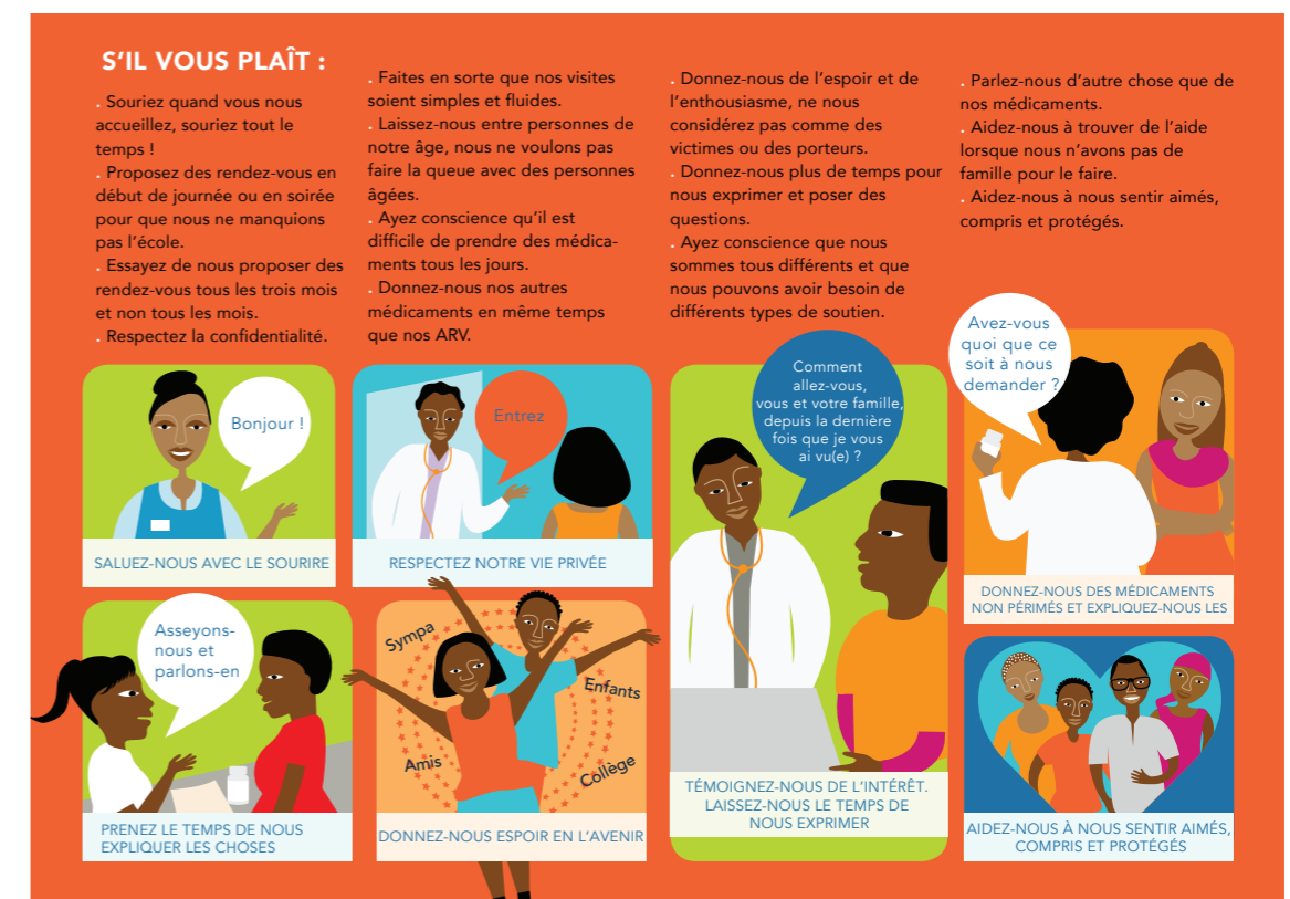
FIGURE 4. LE TABLEAU DE BORD READY TO CARE

Le tableau de bord READY to Care a été élaboré par des jeunes vivant avec le VIH en Eswatini, au Mozambique, en République-Unie de Tanzanie et au Zimbabwe dans le cadre du projet READY+ (Resilient and empowered Adolescents and Young People) (14). Il comprend des « choses à faire et à ne pas faire » pour les prestataires de services, une charte pour des services adaptés aux adolescents et aux jeunes, et une fiche d'évaluation que les personnes âgées de 10 à 24 ans peuvent remplir et soumettre de manière anonyme pour évaluer la qualité des services qu'elles reçoivent. La carte d'évaluation permet aux jeunes de contrôler les soins de santé, tout en sensibilisant les prestataires de soins à la manière dont les jeunes vivant avec le VIH souhaitent être impliqués et traités, ainsi qu'aux résultats globaux qu'ils attendent des services.