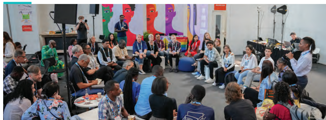
(Munich, Germany | Y+ Global and LetsStopAIDS, July 2024)