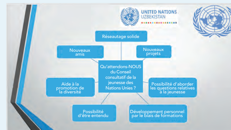
FIGURE 6. AVANTAGES DE FAIRE PARTIE DU CONSEIL CONSULTATIF DE LA JEUNESSE EN OUZBÉKISTAN

Les avantages de la participation au Conseil consultatif de la jeunesse comprennent la possibilité de soulever des questions relatives à la jeunesse, la chance d'être entendu et la promotion de la diversité (figure 6).