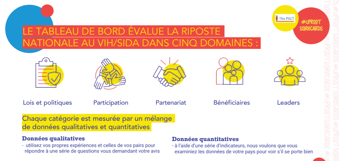
FIGURE 5. DOMAINES ÉVALUÉS PAR LES FICHES D'ÉVALUATION DE LA RESPONSABILITÉ DES JEUNES DANS LE CADRE DE #UPROOT