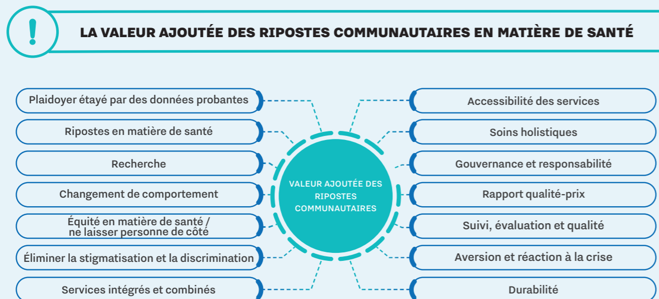
FIGURE 1. VALEUR AJOUTÉE DES RIPOSTES COMMUNAUTAIRES

Les ripostes communautaires sont également pertinentes dans le contexte plus large des soins de santé, car elles sont fondamentales pour l'équité en matière de santé. Elles promeuvent la santé en tant que droit de l'homme, veillent à ce que personne ne soit laissé pour compte et améliorent les résultats en matière de santé pour tous. Les ripostes communautaires apportent l'innovation, la qualité, l'échelle et la portée d'une manière inaccessible à d'autres secteurs (2) (figure 1).