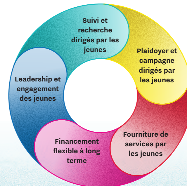
FIGURE 2. COMPOSANTES DES RIPOSTES DIRIGÉES PAR LES JEUNES

– Youba Darif, coordinateur régional, Siba MENA, Maroc