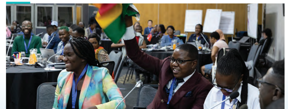
(Jonahsubrg, South Africa | Y+ Global, April 2024)