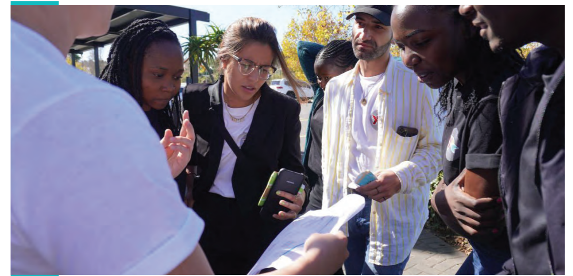
(Cape Town, South Africa | Y+ Global, March 2023)