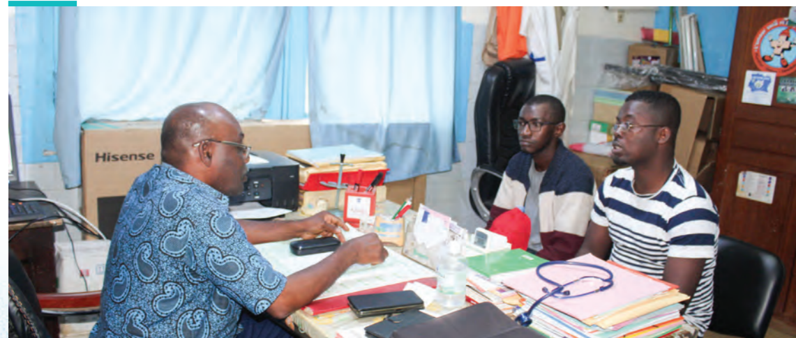
(San Pedro Cote d'Ivoire, The PACT, July 2024)

Dans le cadre du travail et des délibérations sur les ripostes dirigées par les jeunes, The PACT, avec le soutien de l'ONUSIDA, a organisé en 2021 un processus participatif dirigé par et pour les jeunes afin de créer des définitions pour les termes « ripostes dirigées par les jeunes » et « organisations dirigées par les jeunes ». Le processus comprenait une enquête internationale, une analyse documentaire et sept consultations régionales, suivies d'un examen et d'une ratification. Ce processus consultatif mondial a permis d'élaborer des définitions.