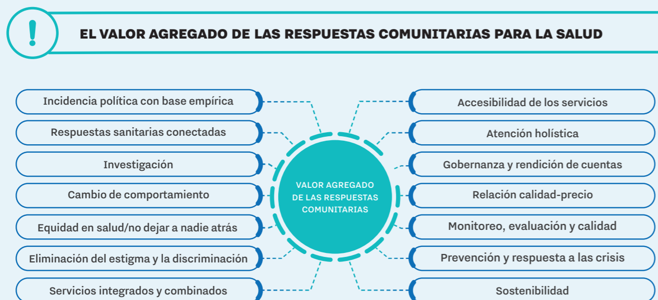
FIGURA 1. VALOR AGREGADO DE LAS RESPUESTAS COMUNITARIAS

Las respuestas comunitarias también son pertinentes en el contexto más amplio de la prestación de servicios de salud porque son fundamentales para la equidad en salud. Promueven la salud como derecho humano, garantizan que "nadie se quede atrás" y mejoran los resultados de salud para todas las personas. Las respuestas comunitarias aportan innovación, calidad, escala y alcance de una forma que otros sectores son incapaces de hacer (2) (figura 1).