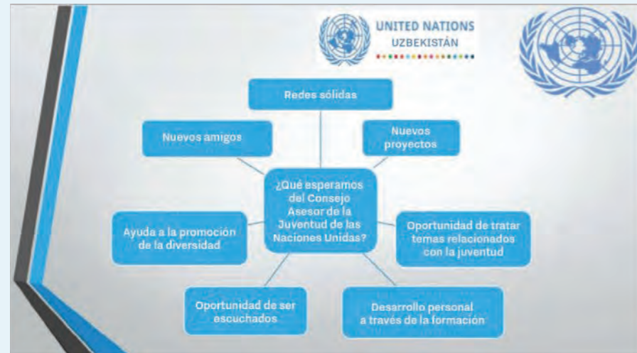
FIGURA 6. VENTAJAS DE FORMAR PARTE DEL CONSEJO ASESOR DE LA JUVENTUD EN UZBEKISTÁN