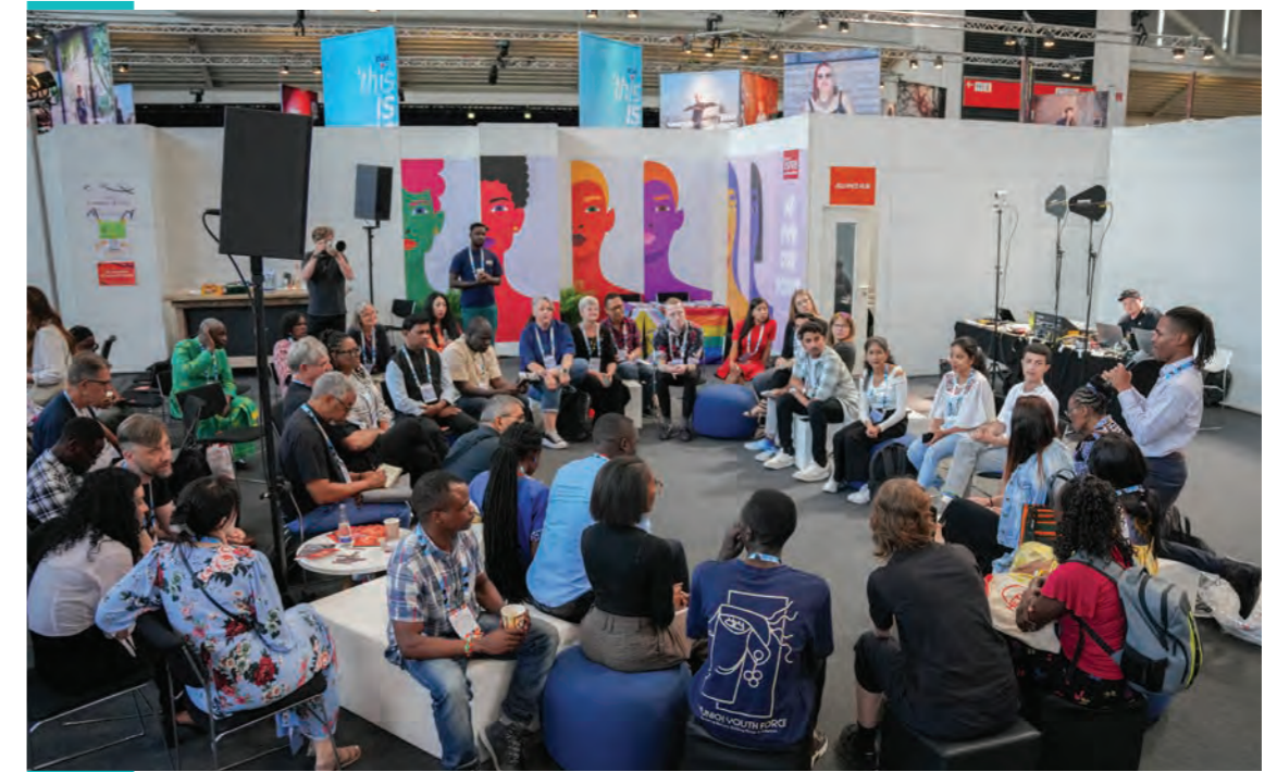
(Munich, Germany | Y+ Global and LetsStopAIDS, July 2024)