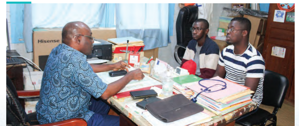
(San Pedro Cote d'Ivoire, The PACT, July 2024)

Como parte del trabajo y las deliberaciones sobre las respuestas lideradas por jóvenes, en 2021 The PACT, con el apoyo de ONUSIDA, convocó un proceso participativo dirigido por y a los jóvenes con el fin de crear definiciones de los términos “respuestas lideradas por jóvenes” y “organizaciones lideradas por jóvenes”. El proceso incluyó una encuesta internacional, una revisión bibliográfica y siete consultas regionales, seguidas de revisión y ratificación. A través de este proceso consultivo global, se elaboraron las definiciones.