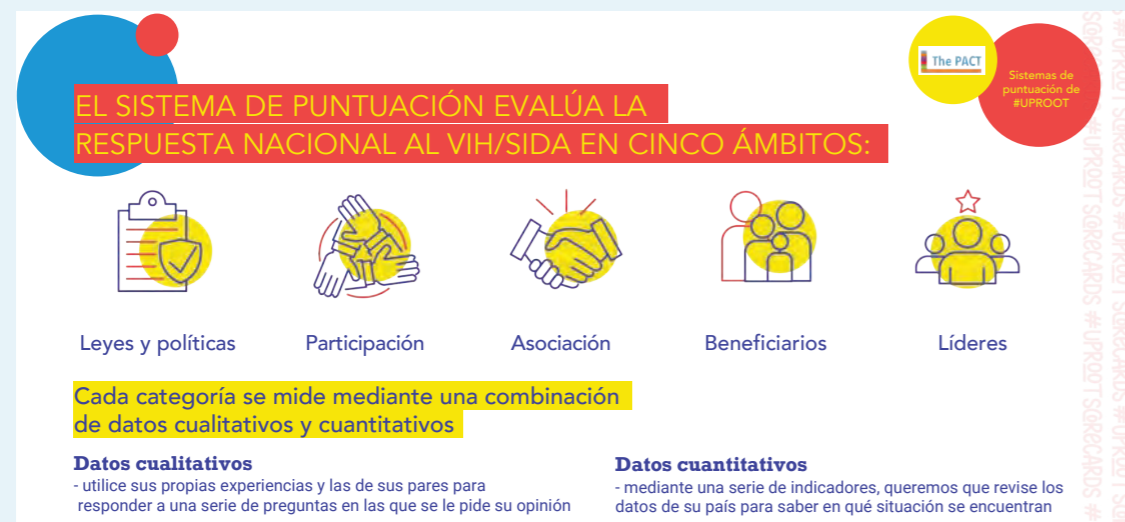
FIGURA 5. ÁMBITOS EVALUADOS POR LOS SISTEMAS DE PUNTUACIÓN SOBRE RENDICIÓN DE CUENTAS LIDERADOS POR JÓVENES DE #UPROOT