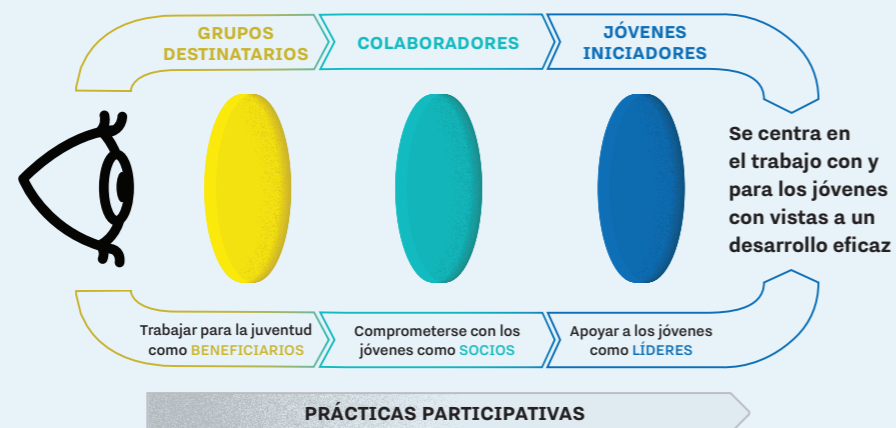
FIGURA 3. USO DEL ENFOQUE DE LAS TRES LENTES

Un buen ejemplo de método que promueve el pleno potencial de los jóvenes es el enfoque de las tres lentes (4, 12), que examina las prácticas participativas a través de las siguientes tres lentes: 1. trabajar para los jóvenes como beneficiarios, 2. colaborar con los jóvenes como socios y 3. apoyar a los jóvenes como líderes (Figura 3).