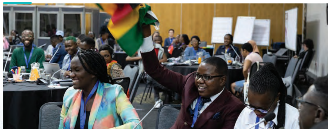
(Jonahsubrg, South Africa | Y+ Global, April 2024)