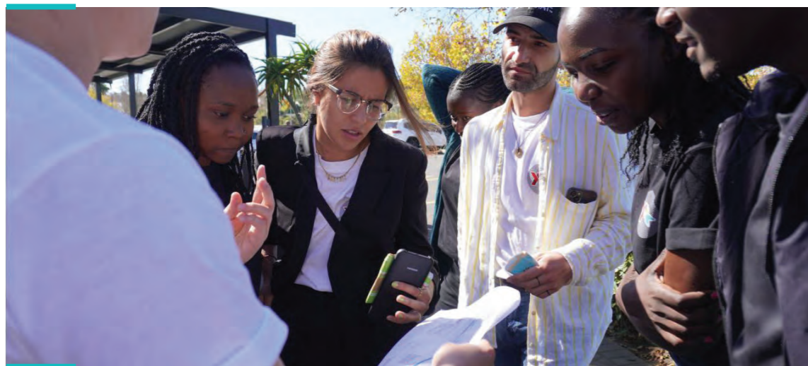
(Cape Town, South Africa | Y+ Global, March 2023)

Las políticas desempeñan un papel crucial en la configuración de las condiciones en las que operan las organizaciones lideradas por jóvenes. Las políticas que dan prioridad a la participación, el empoderamiento y la inclusión de los jóvenes pueden proporcionar a estas organizaciones la legitimidad y el reconocimiento que necesitan para impulsar un cambio significativo. Además, las políticas de apoyo pueden crear oportunidades de colaboración entre las organizaciones lideradas por jóvenes y los organismos gubernamentales, de forma que se fomenten asociaciones que mejoren la repercusión de las iniciativas lideradas por jóvenes. Al defender reformas políticas que aborden las necesidades y preocupaciones de los jóvenes, estas organizaciones pueden contribuir a la creación de sociedades más equitativas e inclusivas.