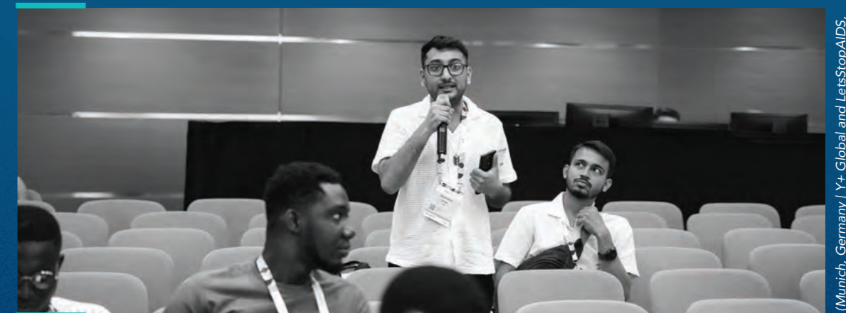
(Munich, Germany | Y+ Global and Let's Stop AIDS, July 2024)