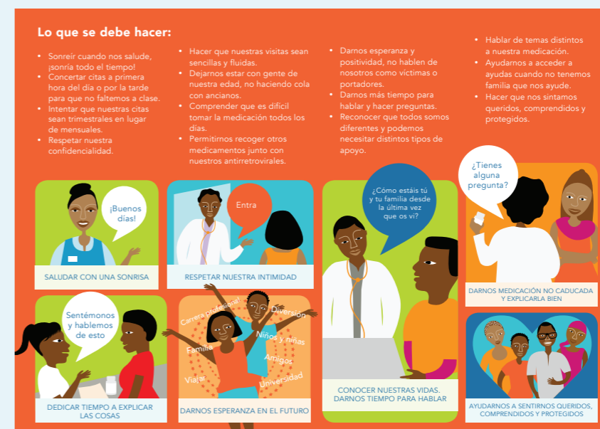
FIGURA 4. SISTEMA DE PUNTUACIÓN READY TO CARE