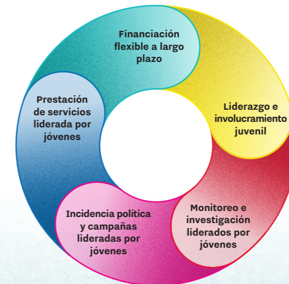
FIGURA 2. COMPONENTES DE LAS RESPUESTAS LIDERADAS POR JÓVENES